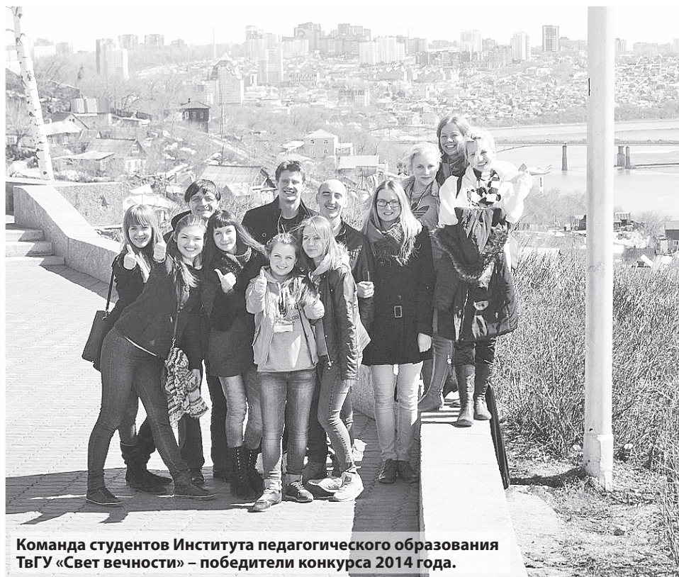
Команда студентов Института педагогического образования ТвГУ «Свет вечности» – победители конкурса 2014 года.

принимающей стороны не мог занять какое-либо место) и системы образования нашей республики. Все остальные участники были равны перед судьями.