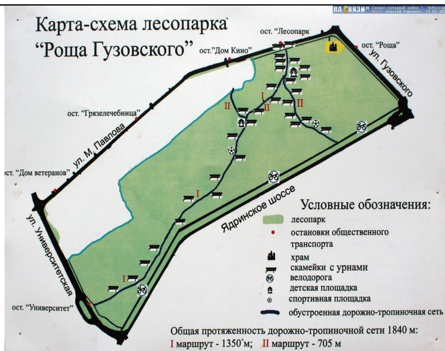
Рисунок. Карта-схема лесопарка «Роща Гузовского»