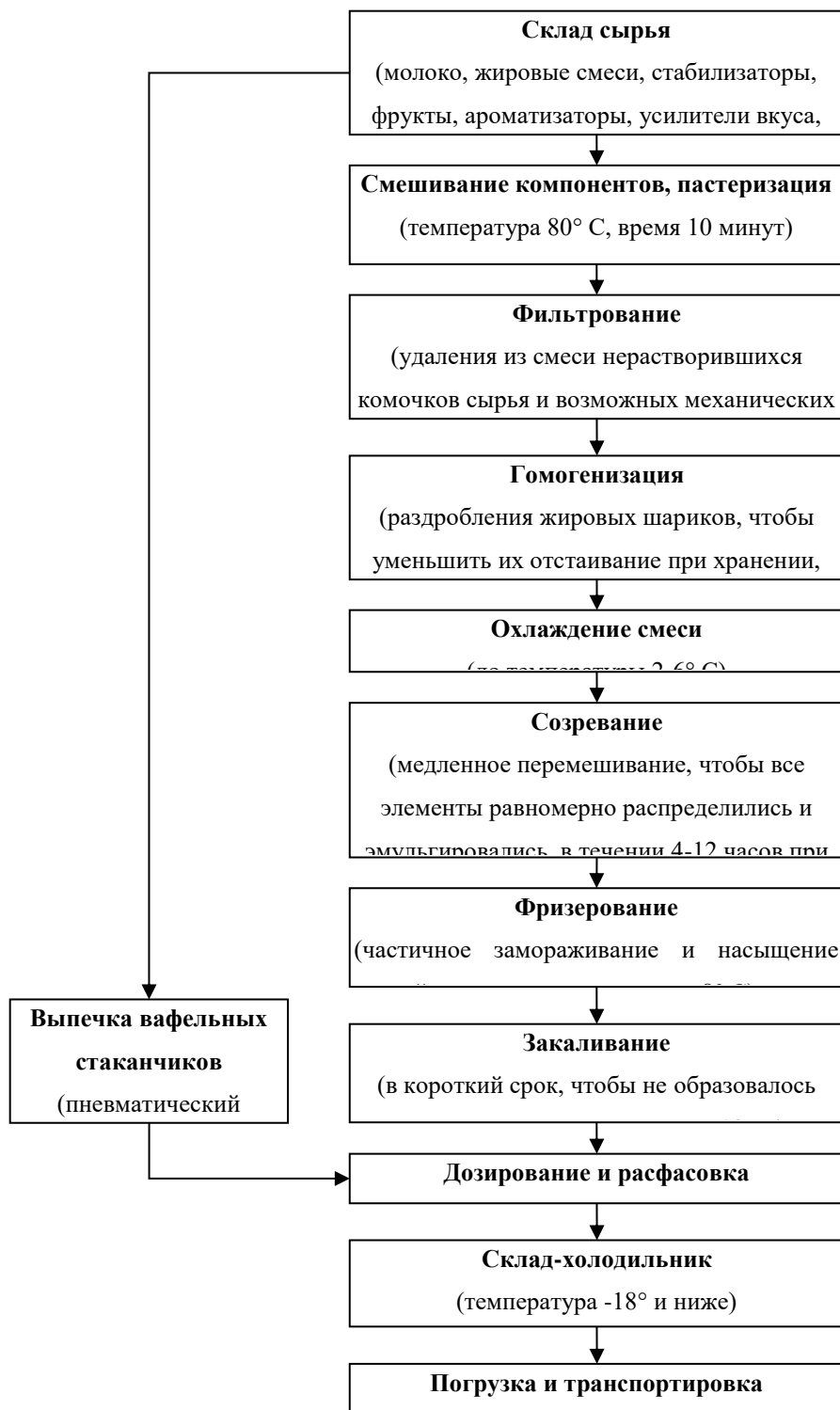
Рис. 5.1. Схема технологического процесса производства мороженого 1 – соблюдение методики анализа карты потоков: показано владение методикой анализа карты потоков – 1 балл; показано недостаточно полное владение методикой анализа карты потоков – 0,5 балла; непоказано владение методикой анализа карты потоков – 0 баллов.